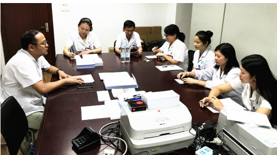
第六党支部开展支部委员学习会议